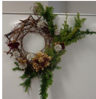
昨年はこのようなリースをつくりました!

開催日:11/23(木曜日・祝日) 時間:10:00~12:00 会場:テニスコート会議室 対象:小学生以上(小学生は保護者同伴) 定員:20組 参加料:1組500円 ※別途材料費1500円 申込日:10/15(日)午前9時から 電話にて受付(先着順)