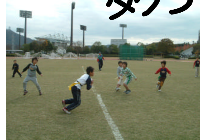
写真は昨年に行われた様子です