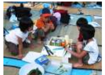
《どうやって切る?子どもたちも野菜を洗って切ると、しっかりお手伝い。》

明けて5時半起床。やはりカブトムシはわなにかからなかったものの虫のためなら早起きも何のその。 朝食の後、昆虫学習、芋畑の草むしりと続きます。畑から蛙、ヤモリ、カニが出てくる度に作業中断。マムシのご対面は無く一安心。草むしりでかいた汗を流しに奥畑川へ。川掃除もやりました。以上、盛りだくさんの林間学校でした。