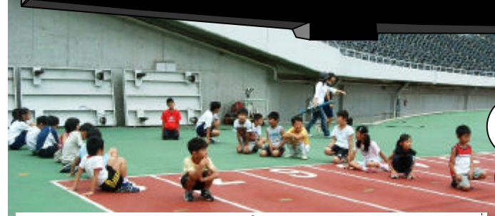
7月 100mスピード王決定戦!!風景